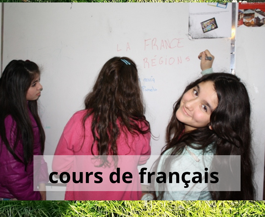
cours de français

L'Alliance Française de Terre de Feu, une association francophile de proximité, pleine de vie et de projets, qui souhaite s'enraciner dans un nouvel espace adapté.