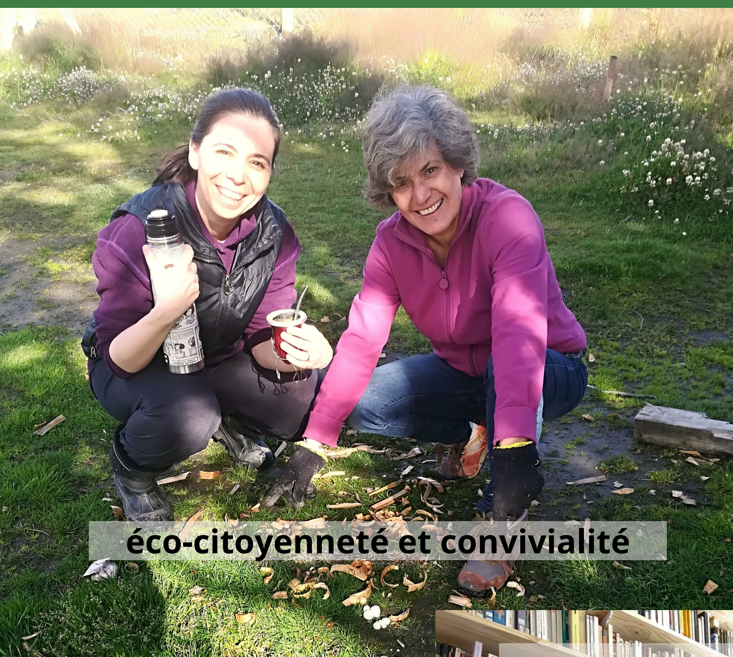
éco-citoyenneté et convivialité