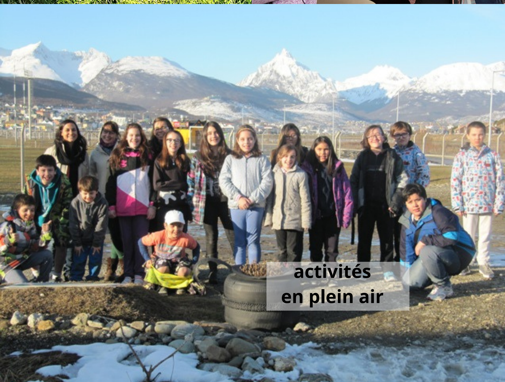
activités en plein air

>>>Programa Cultural Alianza Francesa TDF Concierto de Música de Cámara a cargo de: