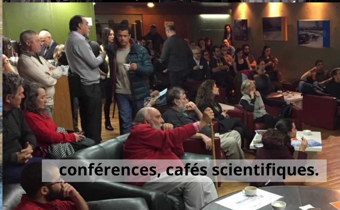
conférences, cafés scientifiques.