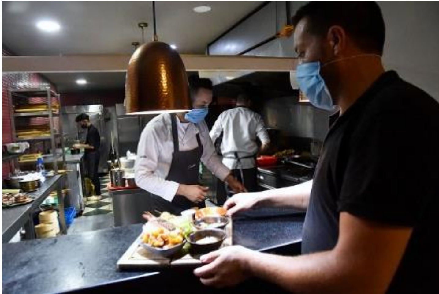
Restaurant à Alger le 19 août 2020.