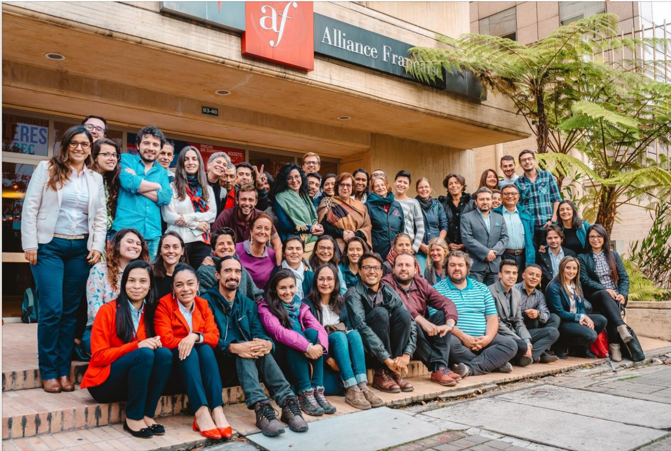
Équipe au grand complet (administratifs en enseignants) à l'occasion des 75 ans de l'Alliance française de Bogota