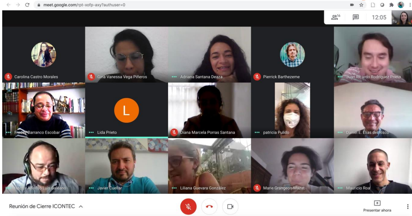
Reunión Zoom début juillet avec les représentants des différents services