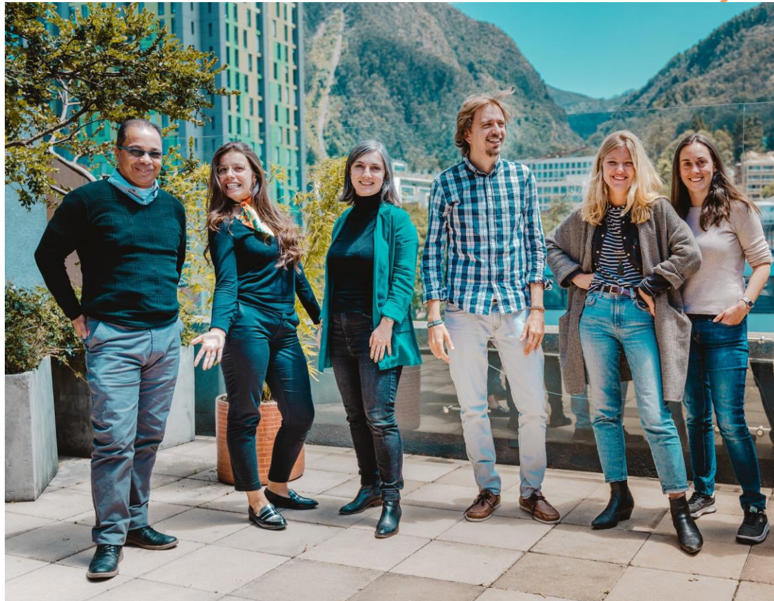
Équipe d'encadrement du Département pédagogique