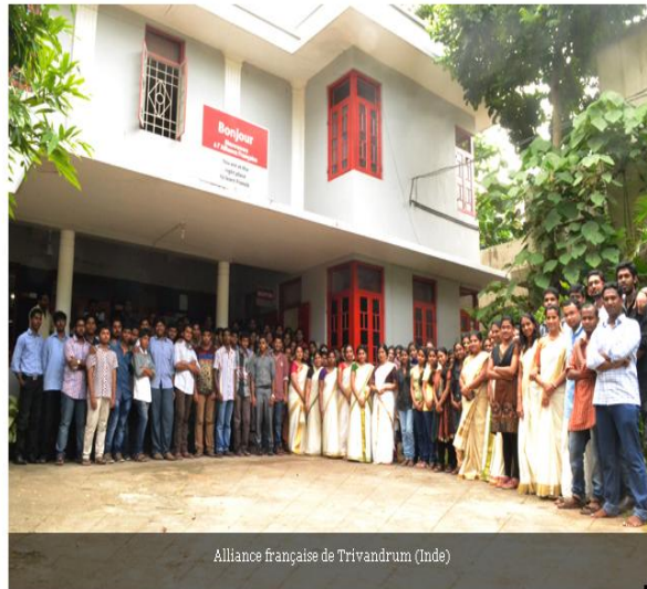
Alliance française de Trivandrum (Inde)