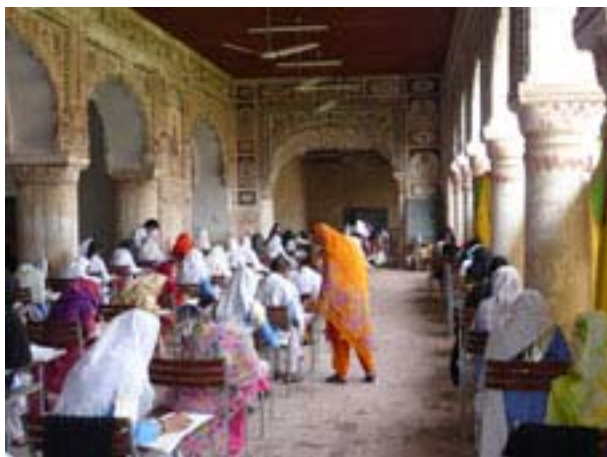
Ecole de jeunes filles

Malgré les difficultés, la « capacité de résilience » de ces Alliances françaises est remarquable. Ses responsables pakistanais et français, comme ses personnels, doivent être félicités pour l'œuvre accomplie contre vents et marées dans ce grand pays qui revêt aujourd'hui une importance particulière dans les équilibres du monde.