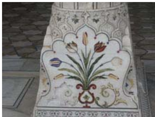
Dans le fort de Lahore

Le Pakistan souffre d'une réputation de violence politique qui, au premier regard, n'apparaît guère usurpée. Créé après le départ des Britanniques par séparation de l'Inde en 1947 pour donner un pays aux musulmans indiens, c'est à son début un étrange état composé de deux territoires séparés par 1600 km (Pakistan oriental et occidental) et qui entre aussitôt en guerre avec le voisin (Inde) à propos du Cachemire. S'y ajoute bientôt une guerre de sécession menée par le Bangladesh, qui vont contribuer au surarmement du pays. Devenu république islamique dès 1956, le pays est marqué par de forts ressentiments, à l'égard d'abord des anciens colonisateurs, mais aussi de l'Inde hindouiste perçue comme menaçante et enfin du Bengale sécessionniste. Nombre d'attentats perdurent dans le pays depuis des années.